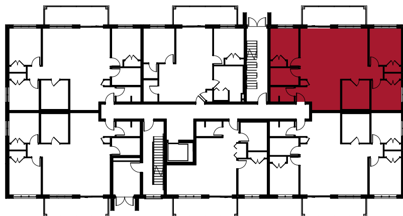
FACADE SUR RUE