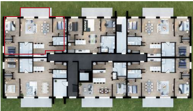
DEVANT DE L'IMMEUBLE